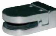
PINZA DE FIJACION Contiene 5 pares de tornillos M10 Código 77885 6-10mm Código 77884 10-16mm