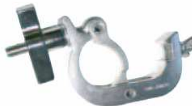
CODIGO 5030 (ST 5070) ABRAZADERA TRIGGER