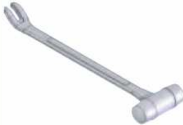
HERRAMIENTA Código 40040