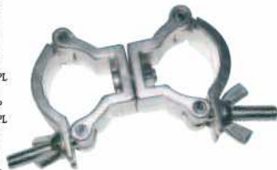
CODIGO 5038-1 (5038-1) ABRAZADERA DOBLE 30MM