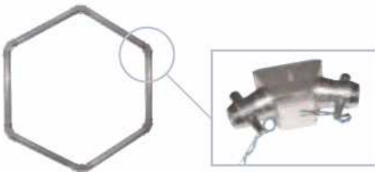
ESTRUCTURA ANGULAR ESPECIAL 120° 4 posibles angulos, incluye 2 medio conectores PL CODE 5007