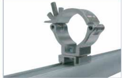
ABRAZADERA PARA RAIL DE 3 FASES Código 888813