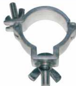
CODIGO 812 (5032) ABRAZADERA 50MM