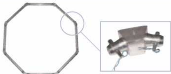
ESTRUCTURA ANGULAR ESPECIAL 135° 4 posibles angulos, incluye 2 medio conectores PL CODE 5008