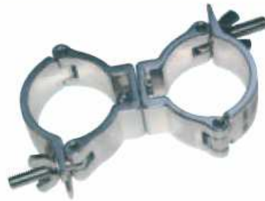
CODIGO 5032-2 (5032D) ABRAZADERA DOBLE 30MM