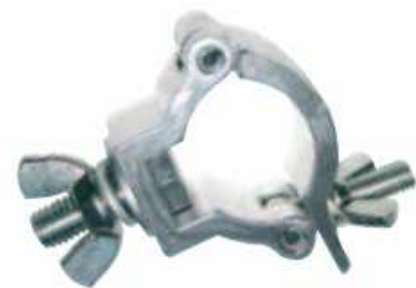
CODIGO 5036 (5036) ABRAZADERA 30MM