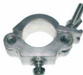
CODIGO 5035-2 ABRAZADERA 30MM