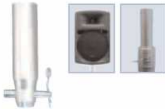
ADAPTADOR HP MEDIO CONECTOR MACHO Diametro 35mm, atura 10cm, incluye pasador y seguro, Compatible F31PL Código 827