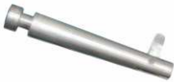
PASADOR Código 50051