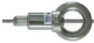
PASACABLES Diametro M12, carga máxima 150kg, BGV-C1. Código 81703