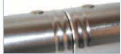
PASADOR CORTO Código pinshort