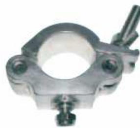
CODIGO 823 (5035) ABRAZADERA 50MM